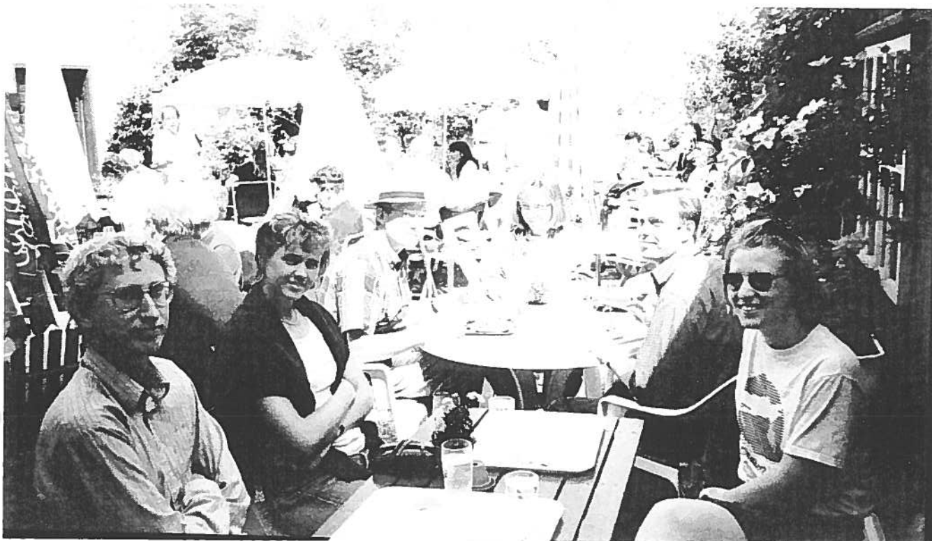
Lunch med Crêpes och fyllda baguetter

På Rosas servering intog vi en god lunch med crêpes och fyllda baguetter. Efterrätten blev givetvis en äkta gotländsk glass på glasscaféet på Stora Torget... Sedan gick vi på olika saker; det bjöds t.ex. på musik i domkyrkan och så måste man ju provsmaka alla gotländska specialiteter som saffranspannkaka med salmbärssylt... Överallt var det underhållning av olika slag; jonglörer, musiker och utanför muren på ett fält kämpade riddare i ett tomerspel.