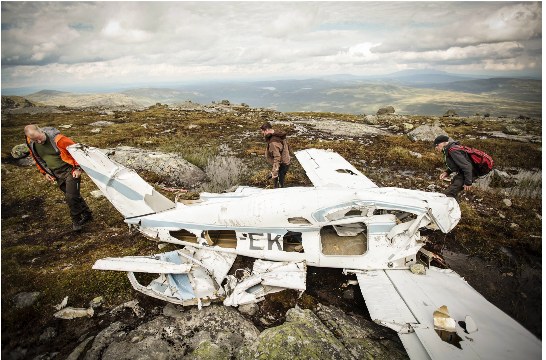
I snart 50 år har flygplanet legat vid Ottfjällets topp. Hade piloterna varit bara 50-75 meter högre upp hade de tagit sig över fjällkammen.

som exakt orsakade dödsolyckan på Ottfjället är än i dag ett mysterium. Att de för sent upptäckt bergkammen och i ett sista desperat försök gasat för att ta sig över är en teori.