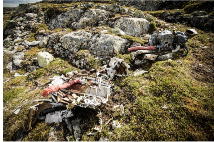
Motorn ligger cirka 50 meter från flygplanskroppen.